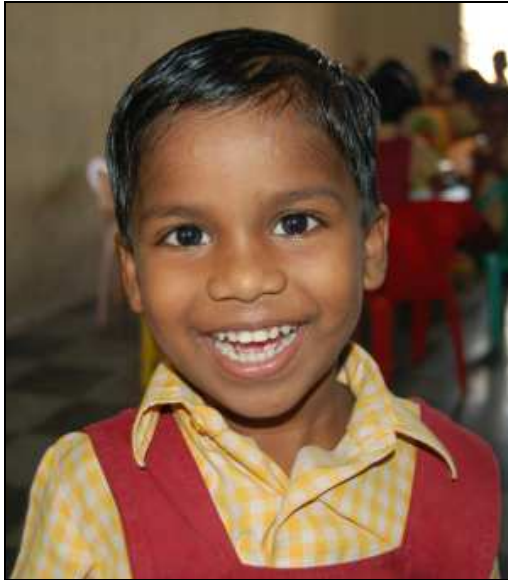
Dieses Waisenkind freut sich, dass ihm die Liebe Gottes weitergeschenkt wurde.

Wir möchten Sie ermutigen, diesen mittellosen Waisenkindern zu helfen. Gemäß dem Schriftwort aus Math. 25,40 „Was ihr für einen meiner geringsten Brüder getan habt, das habt ihr mir getan“ ist uns seit der 4. Gründung des Vereins „EWM-Ein Herz für Indien“ die Hilfe für diese Kinder ein großes Anliegen, unser Motto „Hilfe zur Selbsthilfe“